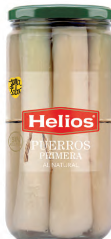
Peso Escurreido / Drained weight: 400 g.