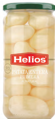
Peso Escurreido / Drained weight: 425 g.