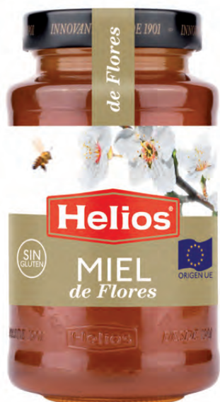
Miel pura en frasco Honey Glass Jar