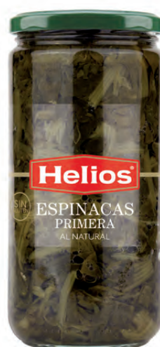
Peso Escurreido / Drained weight: 400 g.