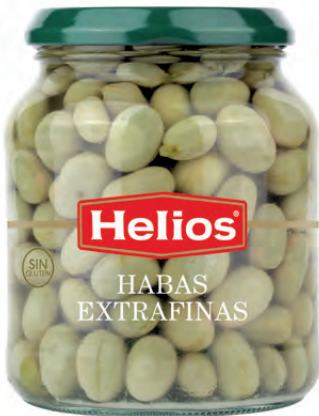
Peso Neto / Net weight: 340 g. Peso Escurrido / Drained weight: 220 g.