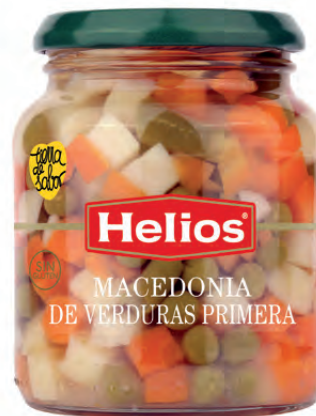
Peso Neto / Net weight: 345 g. Peso Escurrido / Drained weight: 210 g.