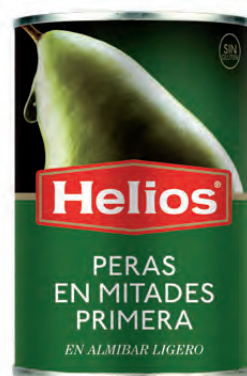
Peso Escurrido / Drained weight: 240 g.