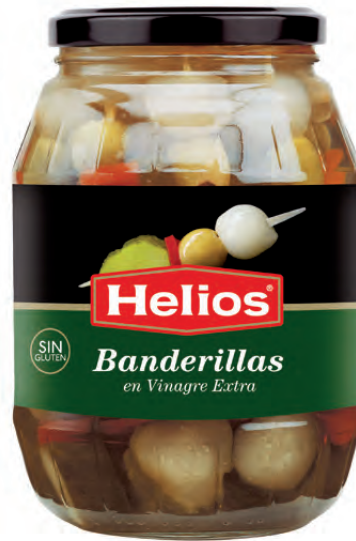
Peso Escurrido / Drained weight: 500 g.