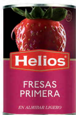
Peso Escurrido / Drained weight: 145 g.