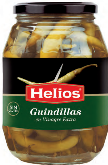
Peso Escurrido / Drained weight: 450 g.