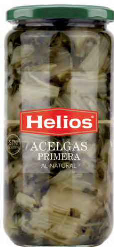
Peso Escurreido / Drained weight: 400 g.