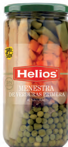
Peso Escurreido / Drained weight: 400 g.