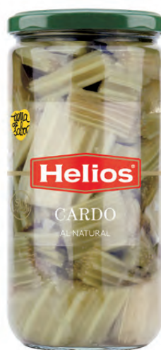
Peso Escurreido / Drained weight: 400 g.