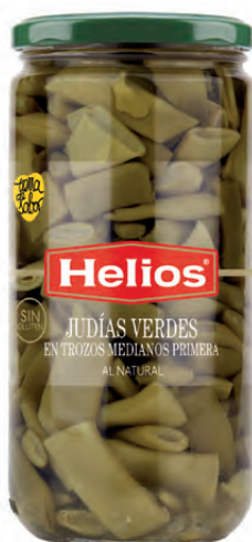
Peso Escurreido / Drained weight: 360 g.