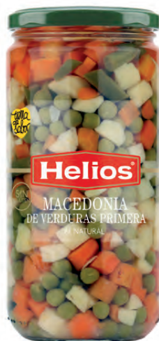
Peso Escurreido / Drained weight: 400 g.