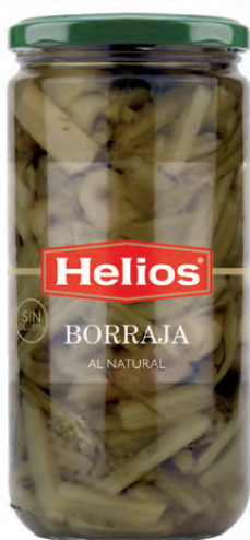
Peso Escurreido / Drained weight: 400 g.