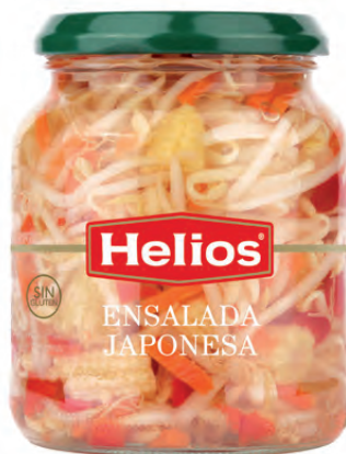
Peso Neto / Net weight: 350 g. Peso Escurrido / Drained weight: 190 g.