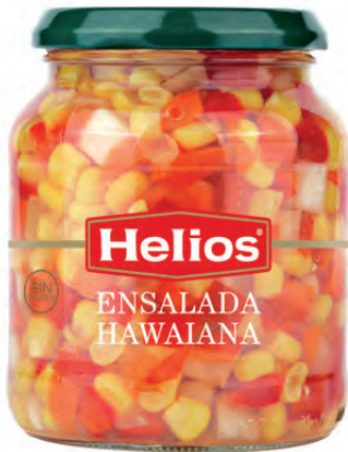
Peso Neto / Net weight: 355 g. Peso Escurrido / Drained weight: 245 g.