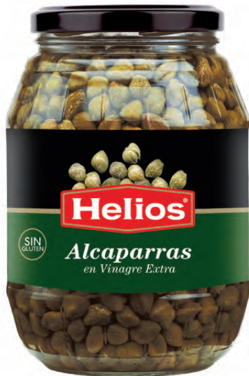
Peso Escurrido / Drained weight: 600 g.