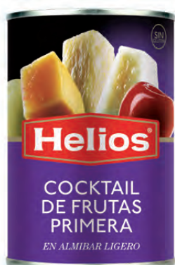
Peso Escurrido / Drained weight: 240 g.