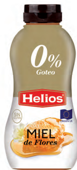
Miel pura antigoteo Non Dropping Honey