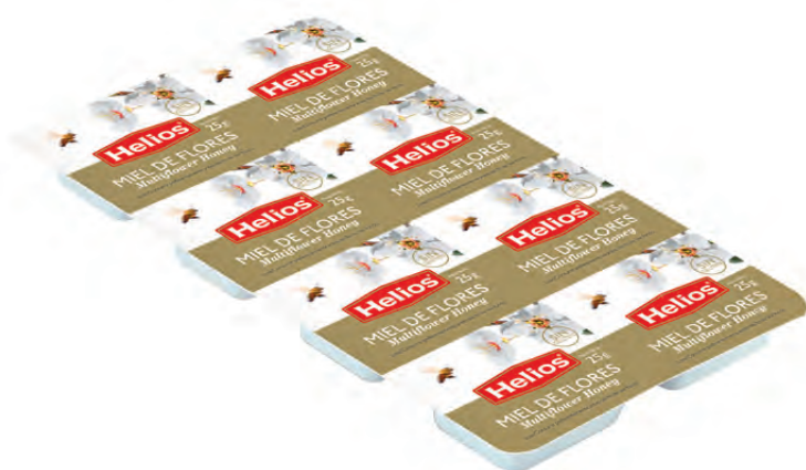
Pack Miel 8 x 25 g. Honey Pack 8 x 25 g.