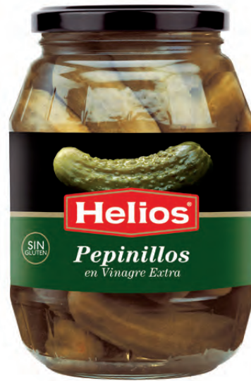
Peso Escurrido / Drained weight: 580 g.