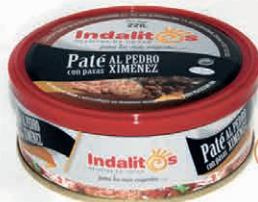
Paté al Pedro Ximénez con pasas