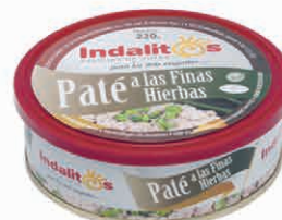
Paté a las Finas Hierbas