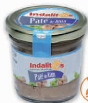
Paté de Atún