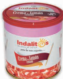
Crema de Jamón Curado