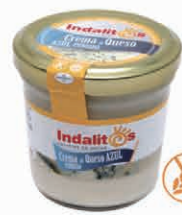
Crema de Queso Azul