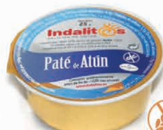
Paté de Atún