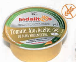
Tomate, Ajo y Aceite