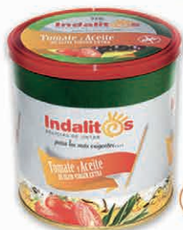
Tomate y Aceite