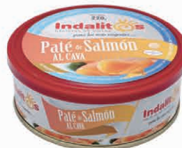
Paté de Salmón al Cava