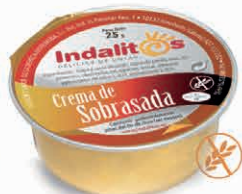
Crema de Sobrasada