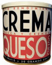
Crema de Queso Curado