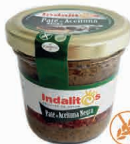
Paté de Aceituna