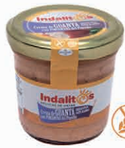
Crema de Guantá con Pimientos del Piquillo