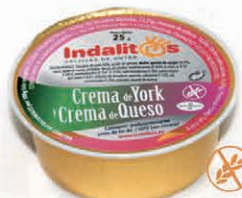
Crema de York y Queso