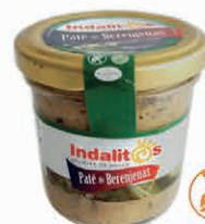
Paté de Berenjenas