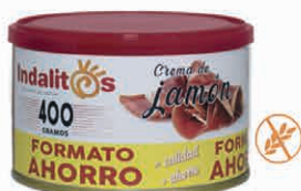
Crema de Jamón