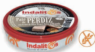
Paté de Perdiz con AOVE al Brandy