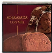
Sobrasada con Miel