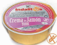
Crema de Jamón York