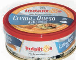
Crema al Queso Azul