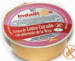
Crema de Lomo Curado con Pimentón de la Vera