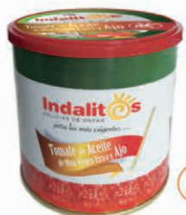
Tomate con Aceite de Oliva Virgen Extra y Ajo