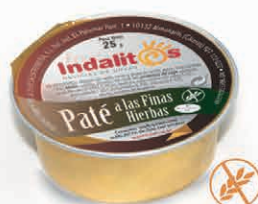
Paté a las Finas Hierbas