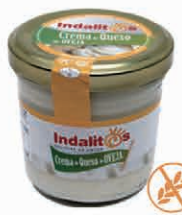
Crema de Queso de Oveja