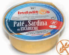
Paté de Sardina en escabeche