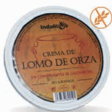
Lomo de Orza