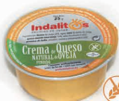
Crema de Queso de Oveja