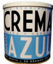
Crema de Queso Azul