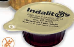
Vinagre - Caja de 360 uds 8 ml - 8,5°