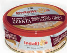
Crema de Guantá (Queso de Oveja de pasta blanda)