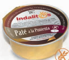
Paté a la Pimienta