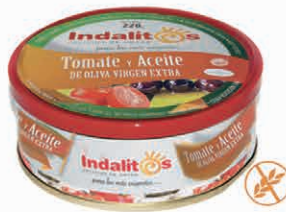
Tomate y Aceite de Oliva Virgen Extra