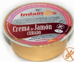
Crema de Jamón Curado