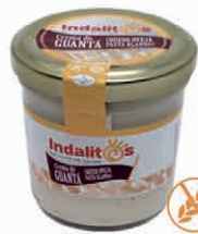
Crema de Guantá (Queso de Pasta Blanda)