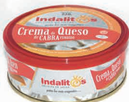
Crema de Queso de Cabra