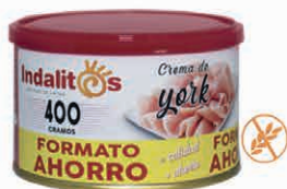
Crema de York