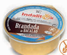
Pate de Bacalao