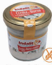
Crema de Queso de Cabra con Miel