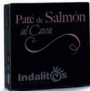
Paté de Salmón al Cava