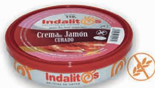
Crema de Jamón Curado