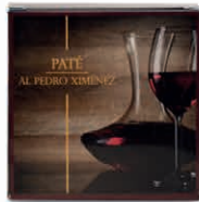
Paté al Pedro Ximénez