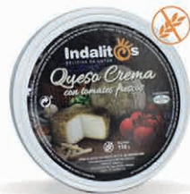
Queso Crema con tomates frescos