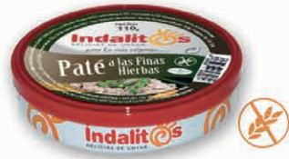
Paté a las Finas Hierbas