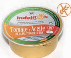
Tomate y Aceite