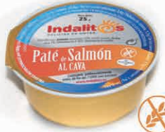
Paté de Salmón al cava