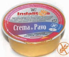
Crema de Pavo