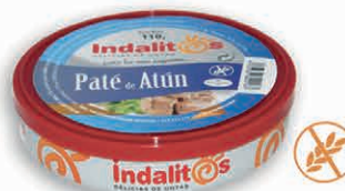
Paté de Atún