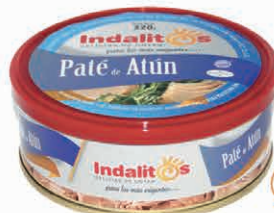
Paté de Atún