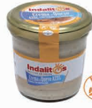
Crema de Queso Azul con Cebolla Caramelizada