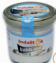
Brandada de Bacalao