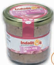
Crema de Jamón York