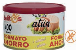
Paté de Atún