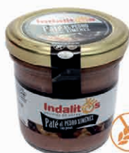
Paté al Pedro Ximénez