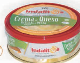
Crema de Queso de Oveja