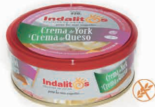
Crema de York y Queso