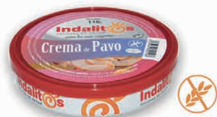
Crema de Pavo