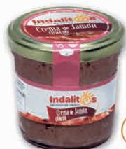
Crema de Jamón Curado