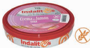
Crema de Jamón York