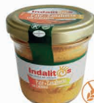
Paté de Zanahoria