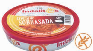
Crema de Sobrasada