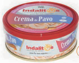
Crema de Pavo