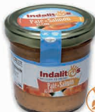
Paté de Salmón