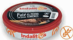
Paté al Pedro Ximénez