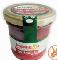
Paté de Remolacha