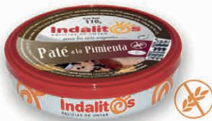
Paté a la Pimienta