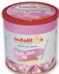
Crema de Jamón York