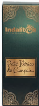
Paté Ibérico de Campaña