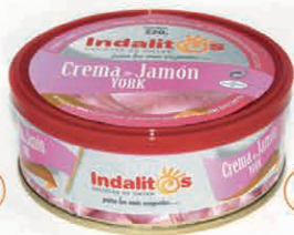
Crema de Jamón York