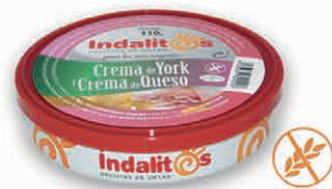
Crema de York y Queso