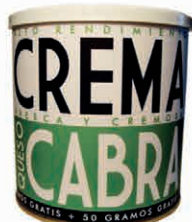
Crema de Queso de Cabra