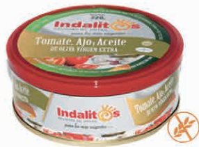
Tomate, Ajo y Aceite