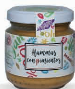
Hummus con Pimientos