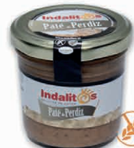
Paté de Perdiz