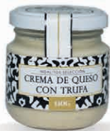
Crema de Queso con Trufa