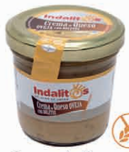
Crema de Queso de Oveja con Boletus