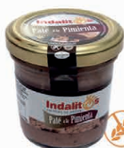
Paté a la Pimienta