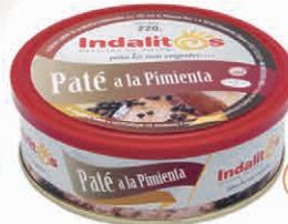
Paté a la Pimienta