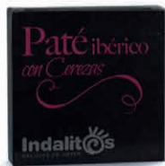
Paté Ibérico con Cerezas