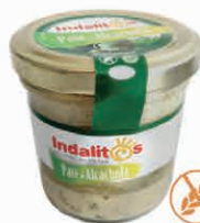
Paté de Alcachofa