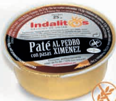
Paté al Pedro Ximénez con pasas