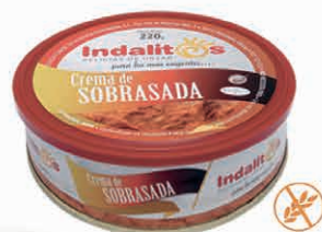
Crema de Sobrasada