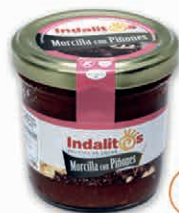
Morcilla de Piñones