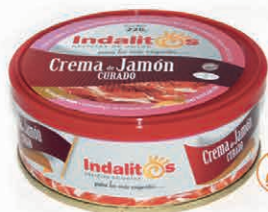
Crema de Jamón Curado