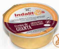
Crema de Guantá (Queso de Oveja de pasta blanda)