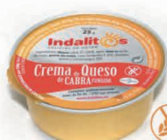
Crema de Queso de Cabra