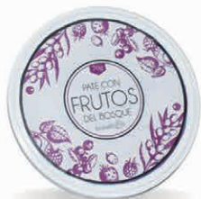
Paté con Frutos del Bosque