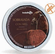
Sobrasada con miel