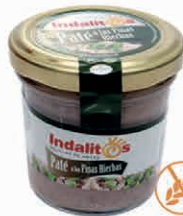
Paté a las Finas Hierbas