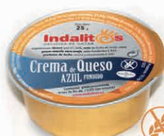
Crema al Queso Azul