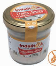
Crema de Queso de Cabra